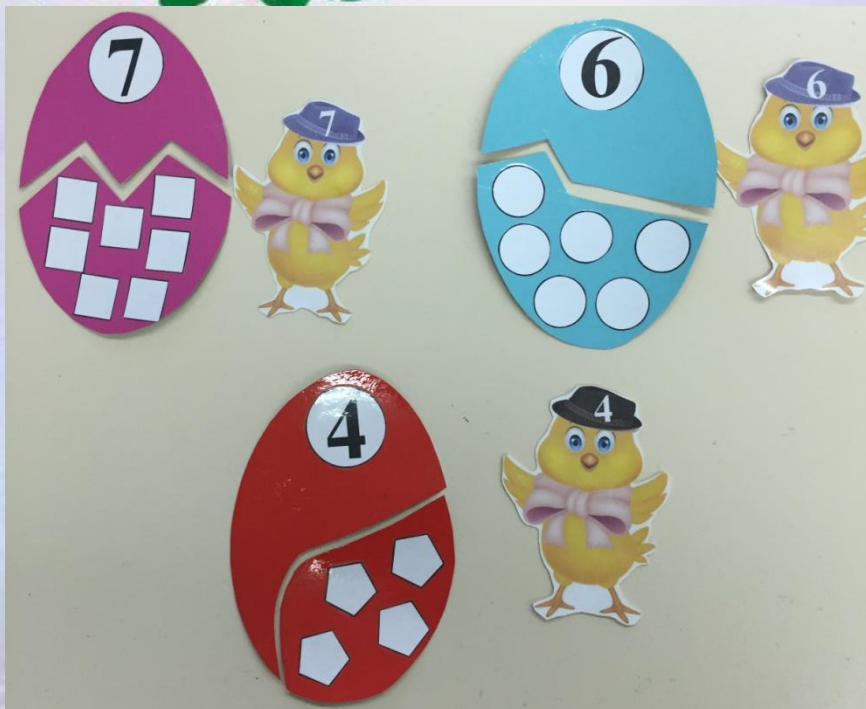
Игра «Посели цыпленка в свой домик»